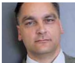
Mauro Batini Sistemi Informativi