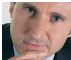
Fabio Panada Internet Security Systems

d'intervenire sullo stesso in modo diretto, potrebbe comunque essere utile ispezionarlo per comprenderne il funzionamento.